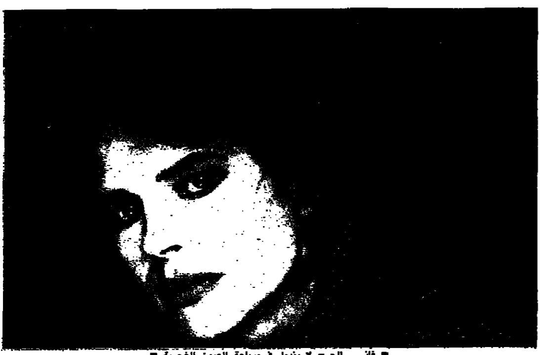
فاني - الجرح لا ينمل في مسحة العيون الجريحة